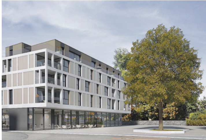
Une image d'illustration du projet avec, à droite, la place du Marché telle qu'elle pourrait se présenter.